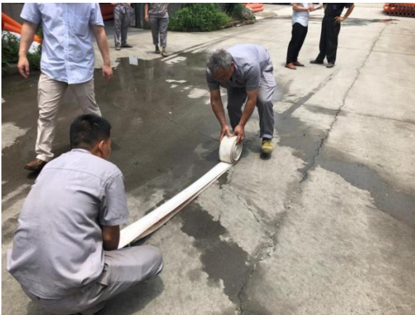
图 6.3-01 消防演练现场

公司每年举行消防演练和各种灾害应急演练。公司制订了《配电房火灾、爆炸应急预案》等应急预案、《触电事件应急预案》、《重大设备故障应急预案》等应急处置方案等，对火灾、机械、触电等均有相应的应急措施，并成立了应急指挥中心和应急救援专业组。